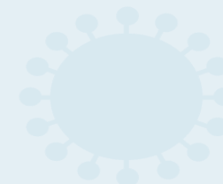
Prime somministrazioni e richiami (MMG + Rsa)